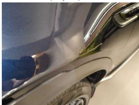
Aile avant gauche (Rayure)